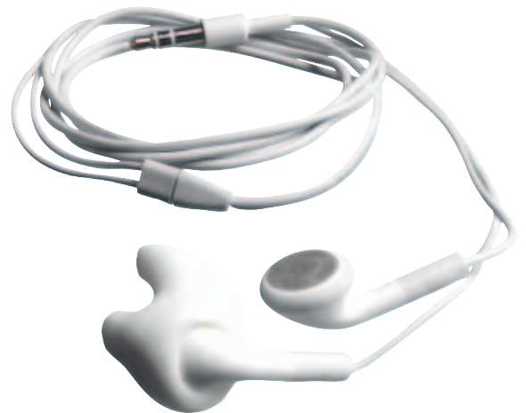
16 mm Standardkopfhörer

Ihr Kunde besitzt bereits einen Kopfhörer, ein InEar Monitoring oder ein Headset und wünscht mehr Komfort?