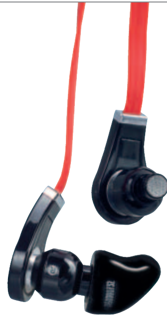
InEar Monitoring zum Einklicken