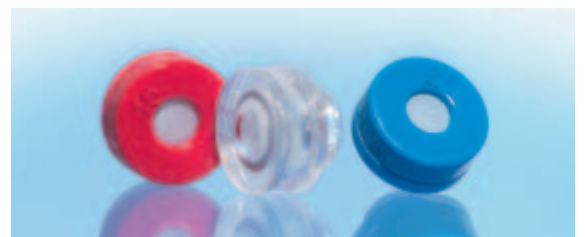
bachmaiER 9 · 15 · 25 – das Original